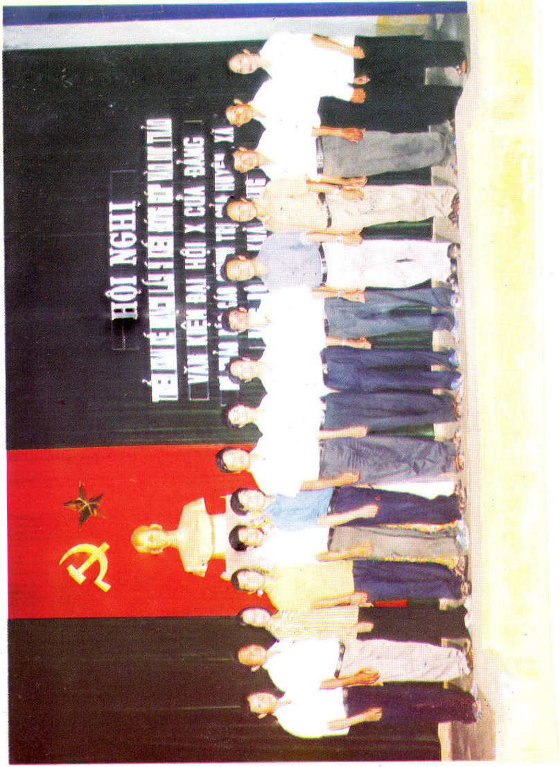
Ban chấp hành Đảng bộ xã Khả Phong Khoa 24, nhiệm kỳ (2000-2005)